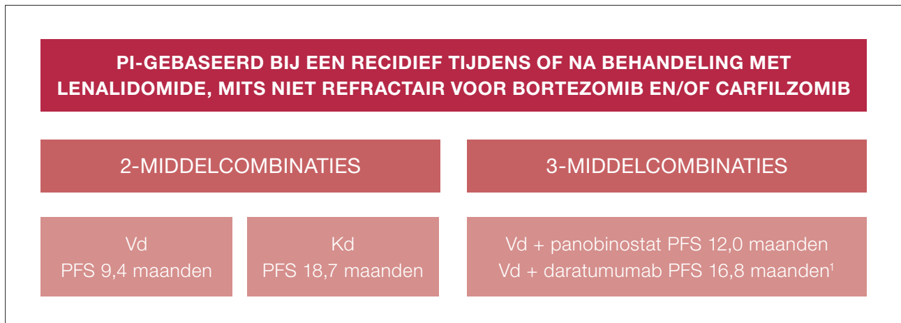
FIGUUR 1. Behandelalgoritme voor patiënten die een recidief ontwikkelen tijdens of na behandeling met lenalidomide, mits niet refractair voor bortezomib en/of carfilzomib. Behandel mogelijkheden na of tijdens behandeling met lenalidomide. Bij voorkeur overgaan op een proteasoomremmer-gebaseerd regime zoals in de figuur is weergegeven. Echter bij langzaam progressieve ziekte, ontbreken van CRAB-symptomen en/of specifieke comorbiditeit kan een herhaalde behandeling met Rd of een Rd-gebaseerd regime worden overwogen, alleen indien het recidief >6 maanden na het staken van lenalidomide optreedt en de patiënt tevoren nooit refractair was voor lenalidomide (dus NIET refractair voor lenalidomide op enig moment). Bedenk bij patiënten die in aanmerking komen voor een auSCT of een tweede transplantatie dat dit nog tot de mogelijkheden behoort na re-inductie met bovenstaande regimes. Zie hiervoor in de tekst.